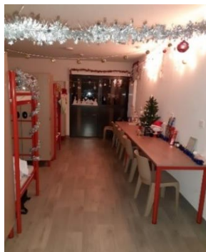
Chambre des filles